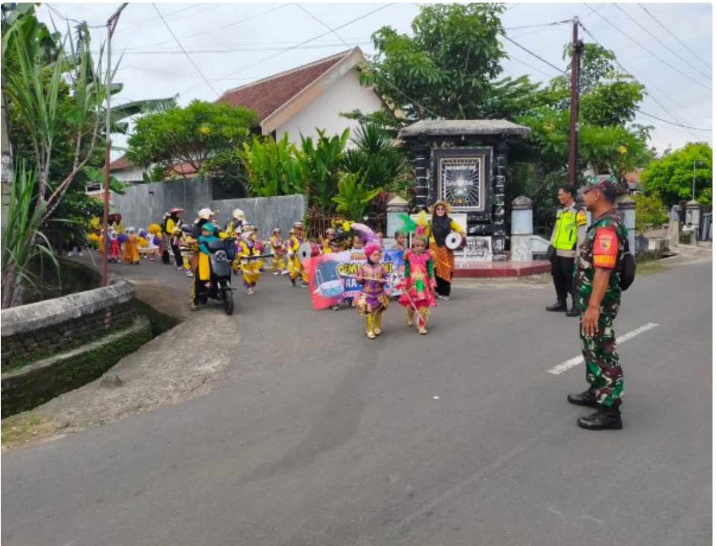
Gebyar Rojabiyah RA dan MI, Babinsa bersama Bhabinkamtibmas Amankan Jalannya Kegiatan Parade Drum Band