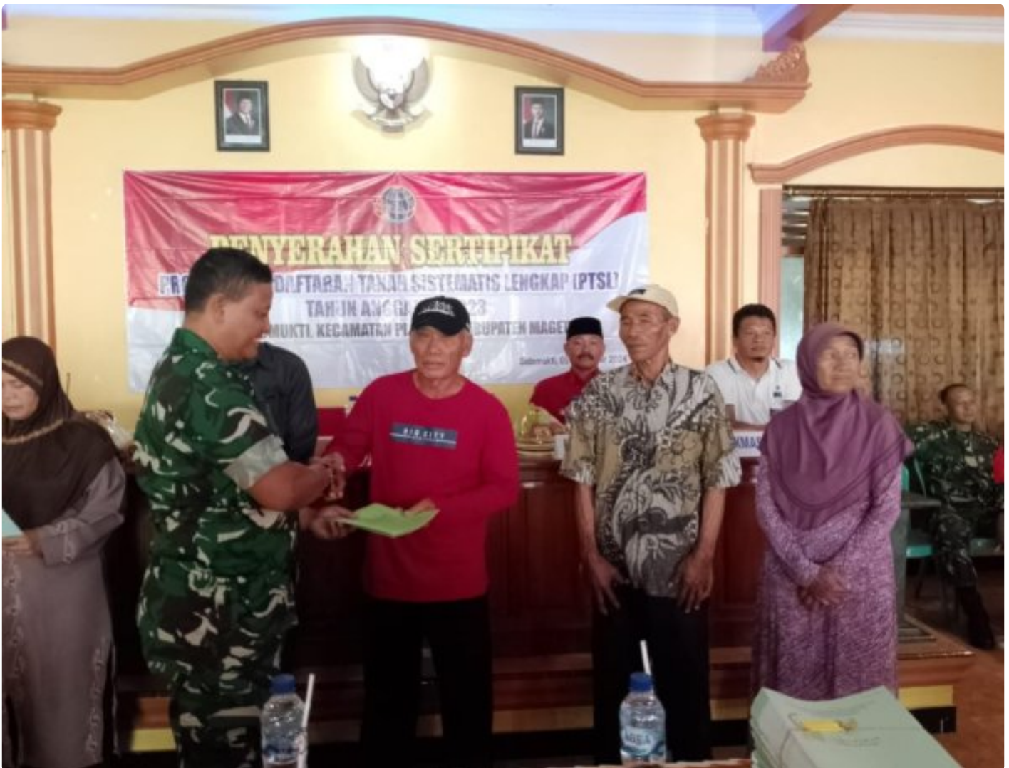
Danramil 0804/02 Plaosan Hadiri Penyerahan Sertifikat Program Pendaftaran Tanah Sistematis Lengkap (PTSL) Desa Sidomukti

PLAOSAN. - Desa Sidomukti melalui Badan Pertanahan Nasional (BPN) melakukan penyerahan Sertifikat Tanah Program Pendaftaran Tanah Sistematis