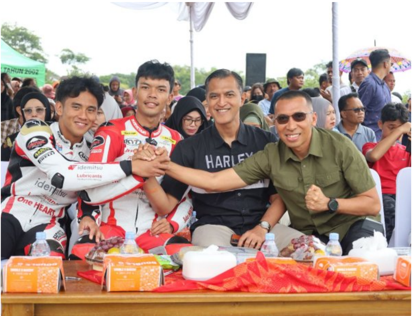
Dandim 0804/Magetan Hadiri Undangan Tinjau Sirkuit Magetan